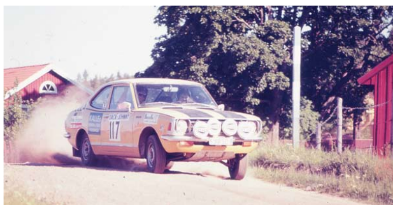
Bild från tävlingen Värmland runt 1971. Donerad till Bilsportarvet av fotografen.