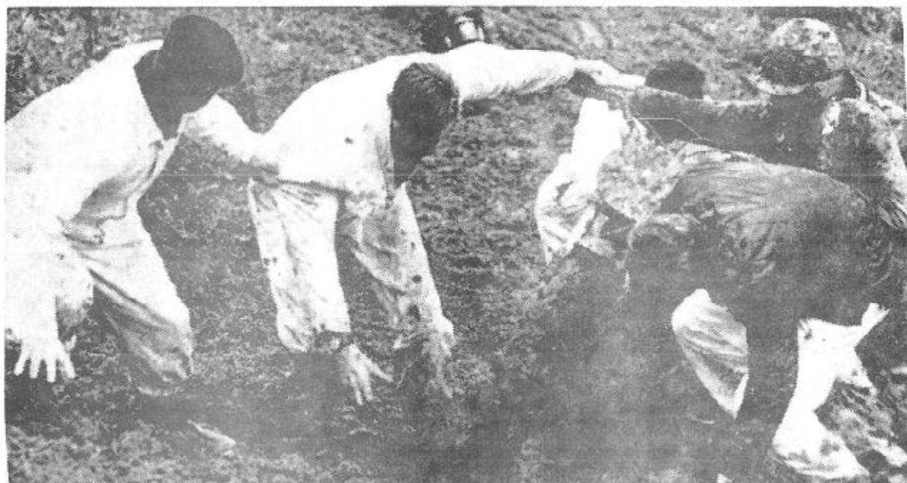
Vid åtskilliga tävlingar på "Duntis" har vädret varit emot arrangemanget. Här har funktionärerna fått bilda kedja för att få loss en stursgubbe.