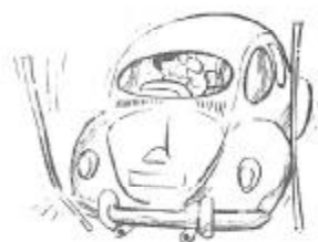
Vid flera tillfällen har SMK:arna försökt "lära ut" bikörning vid manöverprov o dy.